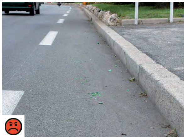
Mauvais entretien rendant la bande impraticable

On évitera aussi les ressauts dus aux raccordements de chaussées ou à la présence de grilles d'évacuation et les grilles de caniveau avec les fentes orientées dans le sens circulation, représentant un risque de chute non négligeable.