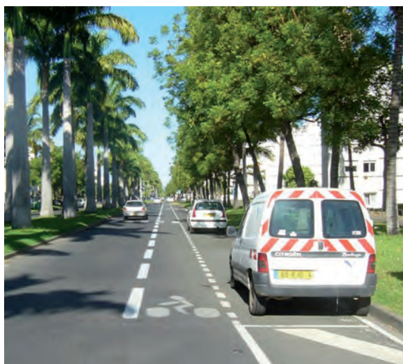
Exemple de bande cyclable