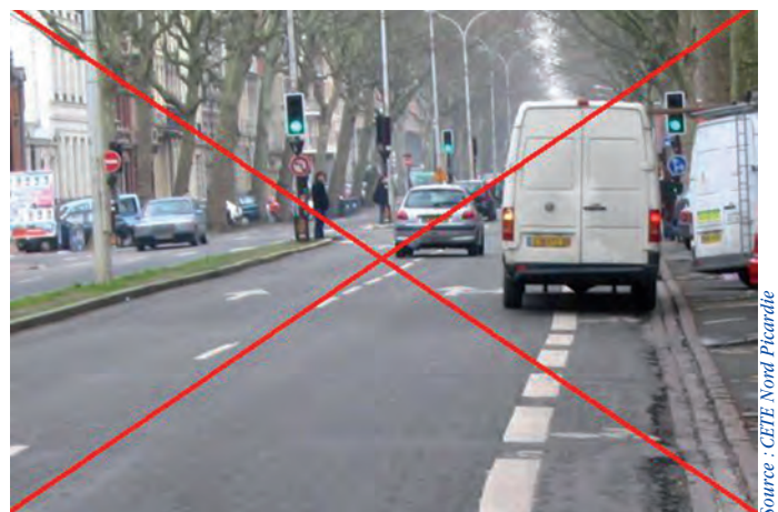
Ce stationnement sur la bande cyclable empêche la progression du cycliste en sécurité

L'implantation d'une bande cyclable implique d'avoir une politique de répression du stationnement sauvage.