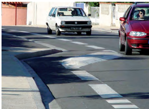
Îlot protégeant le cycliste au niveau d'une chicane

Lors de l'aménagement de chicanes, destinées à la modération des vitesses pratiquées, la continuité de la bande cyclable dans l'aménagement gomme la chicane pour les automobilistes qui optimisent leur trajectoire en circulant sur la bande.