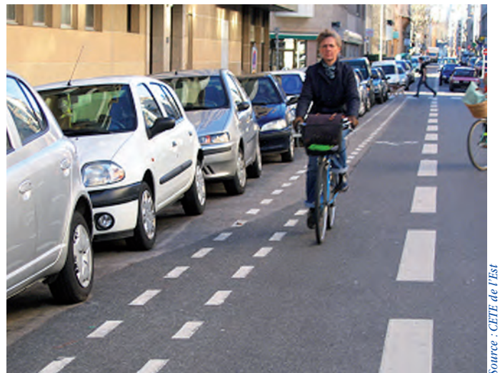
Espace tampon en cas de stationnement longitudinal

Dans le cas d'une bande cyclable longeant des places de stationnement, il est souhaitable de réserver une surlargeur de 0,50 m ou un espace tampon pour permettre l'ouverture inopinée de portières et les manœuvres des automobilistes sans danger pour les cyclistes. Cet espace pourra être en partie obtenu en réduisant la largeur du stationnement.